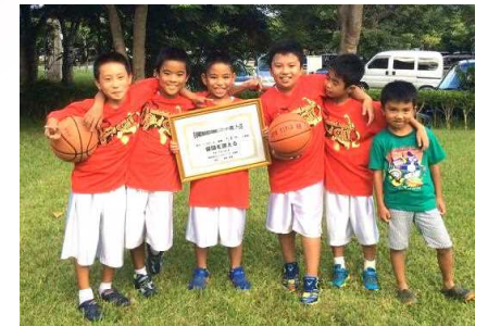
※ 子どもたちの活躍の様子・情報ともしお寄せ下さい。随時紹介していきたいと思ひます。