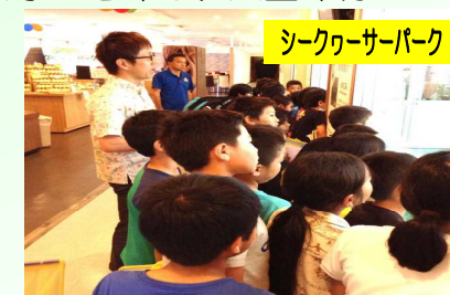
シークワサーパーク