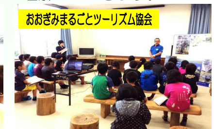
おおきみまるごとツーリズム協会