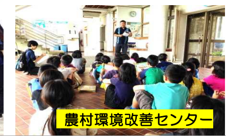
農村環境改善センター