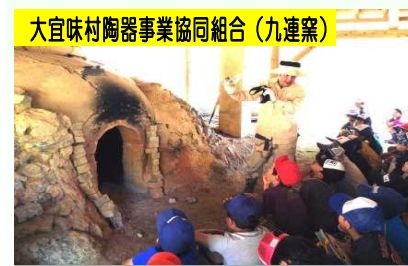
大宜味村陶器事業協同組合(九連窯)