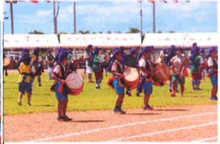
【高学年：エイサー】 中学生とのエイサー、みごとで した！ 指導の青年会、そして地 方のみなさんありがとうございました。