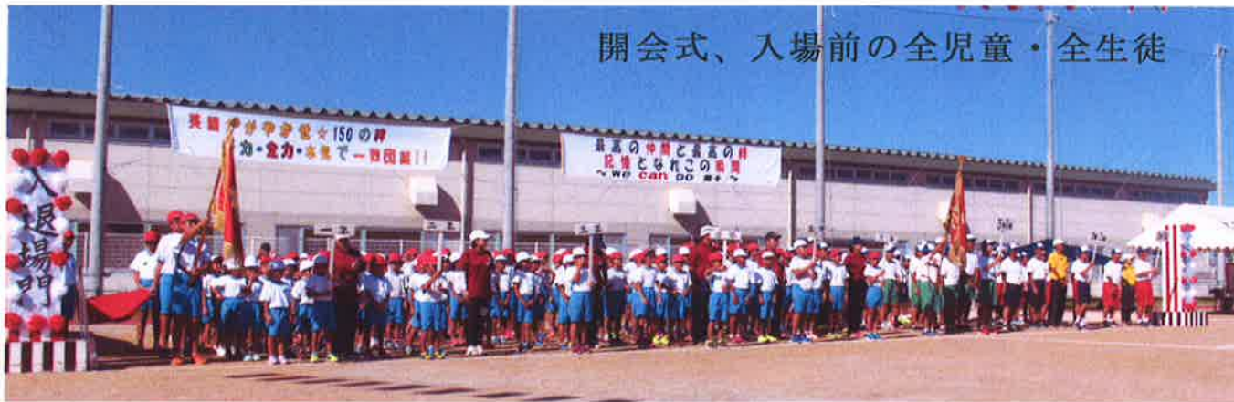
開会式、入場前の全児童・全生徒