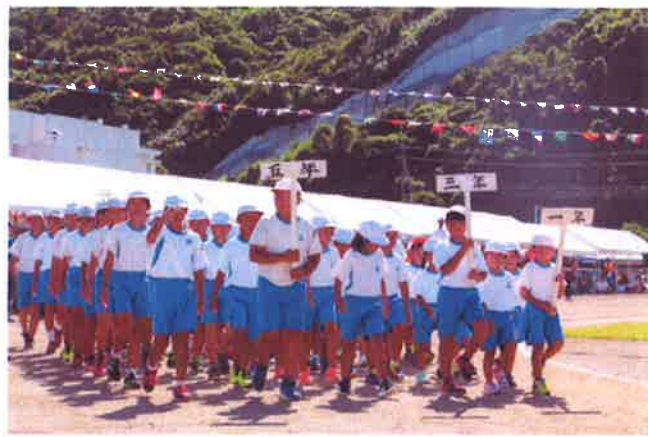
《2・4・6年生》 準備体操後、退場の場面 《1・3・5年生》

がんばったぞ、子ども達。9月19日（日）快晴の運動会日和。家族や大勢の来賓・地域の皆様が見守る中、各学年の演技、全体の演技等みごとにやり遂げました。約2週間の練習期間でしたが、工夫を凝らした隣学年の演技や各係活動も見応えありましたね。