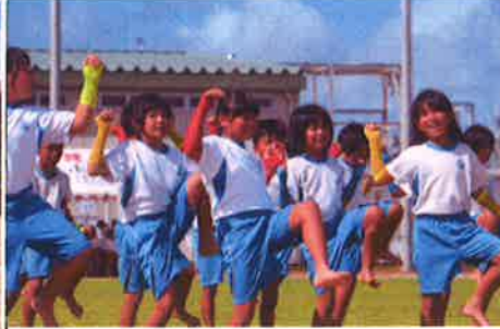
【中学年：組体操・千変万化】 キレイキレイのダンス 決まった組体操 バッチリ！