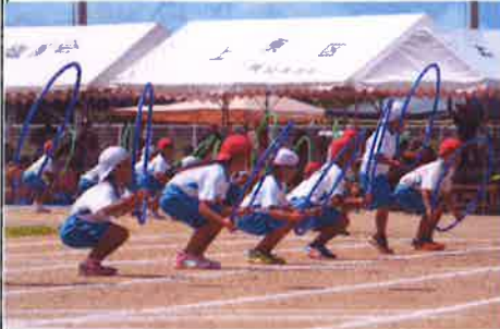
【低学年：ダンス・玉入れ】 いろいろなかわいいポーズ 観客も笑顔になりました！